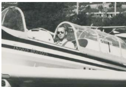
Sion, Juli 1968, nach bestandener Akro-Prüfung mit Zlin 526

Wer denkt nicht gerne öfter mal zurück in die «gute alte Zeit»? Aus heutiger Perspektive erscheint uns das Leben in jungen Jahren einfacher, sorgloser, lockerer und voller positiven Erlebnissen und Perspektiven in Beruf und Privatleben.