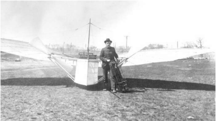
Gustav Weisskopf aus dem mittelfränkischen Leutershausen vor seinem Motorflugzeug im Jahr 1901

Der Franke Gustav Weisskopf könnte noch vor den Gebrüder Wright als erster Mensch motorisiert geflogen sein. Der Luftfahrt-Pionier hat auch Verbindungen nach Augsburg