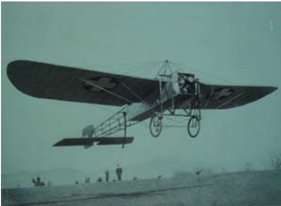
Oscar Bider beim Start vom Beundenfeld in Bern 1913

Mit Oscar Bider tauchte anfangs 1913 plötzlich ein neuer, bisher völlig unbekannter Name auf, der als hellster Stern am aviatischen Firmament unseres Landes während 6 ½ Jahren leuchten und die Geschicke unserer Luftfahrt entscheidend bestimmen sollte.