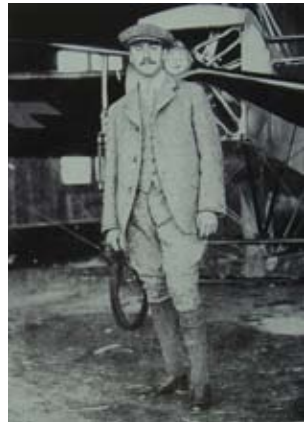
Nach der Landung in Mailand via Domodossola am 13.07.1913